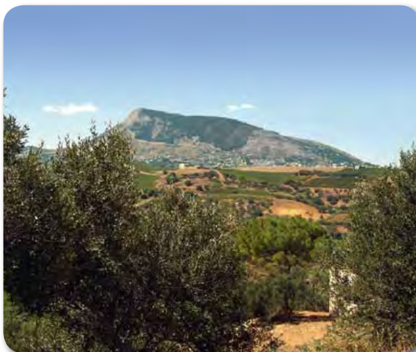
Monte Bonifato, Alcamo

Recentemente ho incaricato gli Uffici per la redazione di progetti miranti alla rinaturalizzazione delle aree protette: per la RNO Isole dello Stagnone di Marsala "la normalizzazione del regime idrodinamico delle acque"; per il Biotopo di Capo Feto l'acquisizione delle zone ancora in mano ai privati e la riqualificazione della costa.